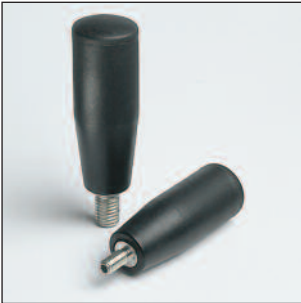
Espiga de acero cincado. PA: Poliamida negra reforzada.